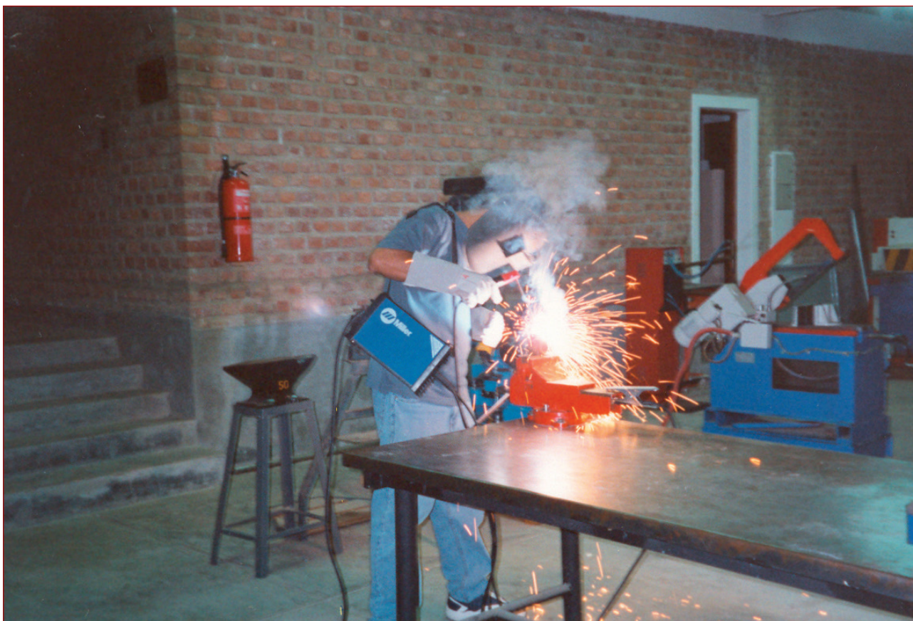
Imagen 7: Taller de Soldadura de Cochabamba (Bolivia)