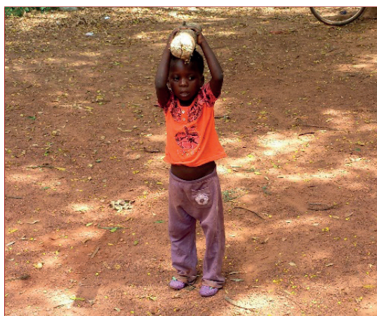
Portando un tronco en Toumodi-Sakassou (Costa de Marfil).