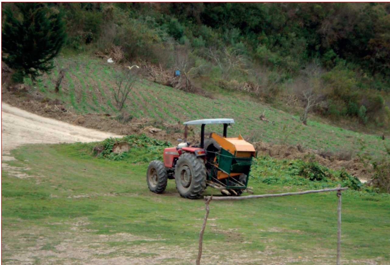
Imagen 5: Maquinaria para las faenas agrícolas en Ajospampa (Bolivia)