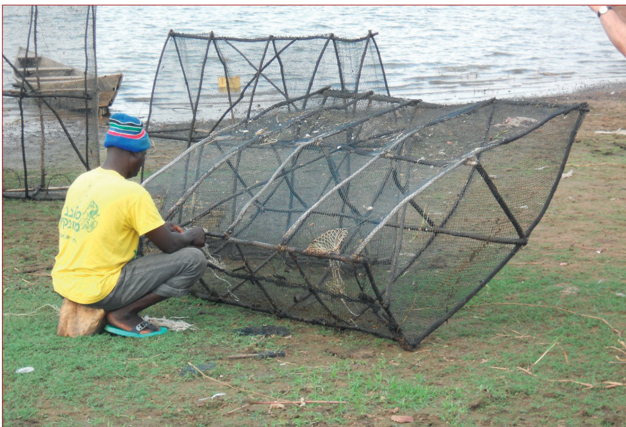
Imagen 8: Preparando las redes en el Lago Kossou (Costa de Marfil)