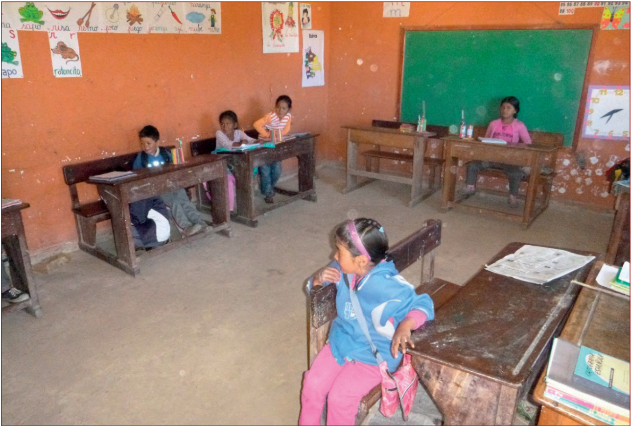
Imagen 3: Escuela campesina de la Siberia Boliviana