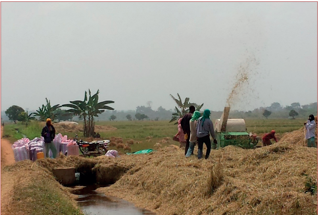
Imagen 2: Tareas para la recolección de arroz en Sakassou (Costa de Marfil)