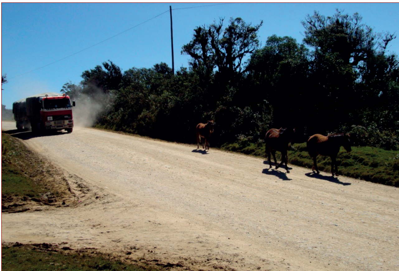
Imagen 6: Transporte por carretera camino de Comarapa (Bolivia)