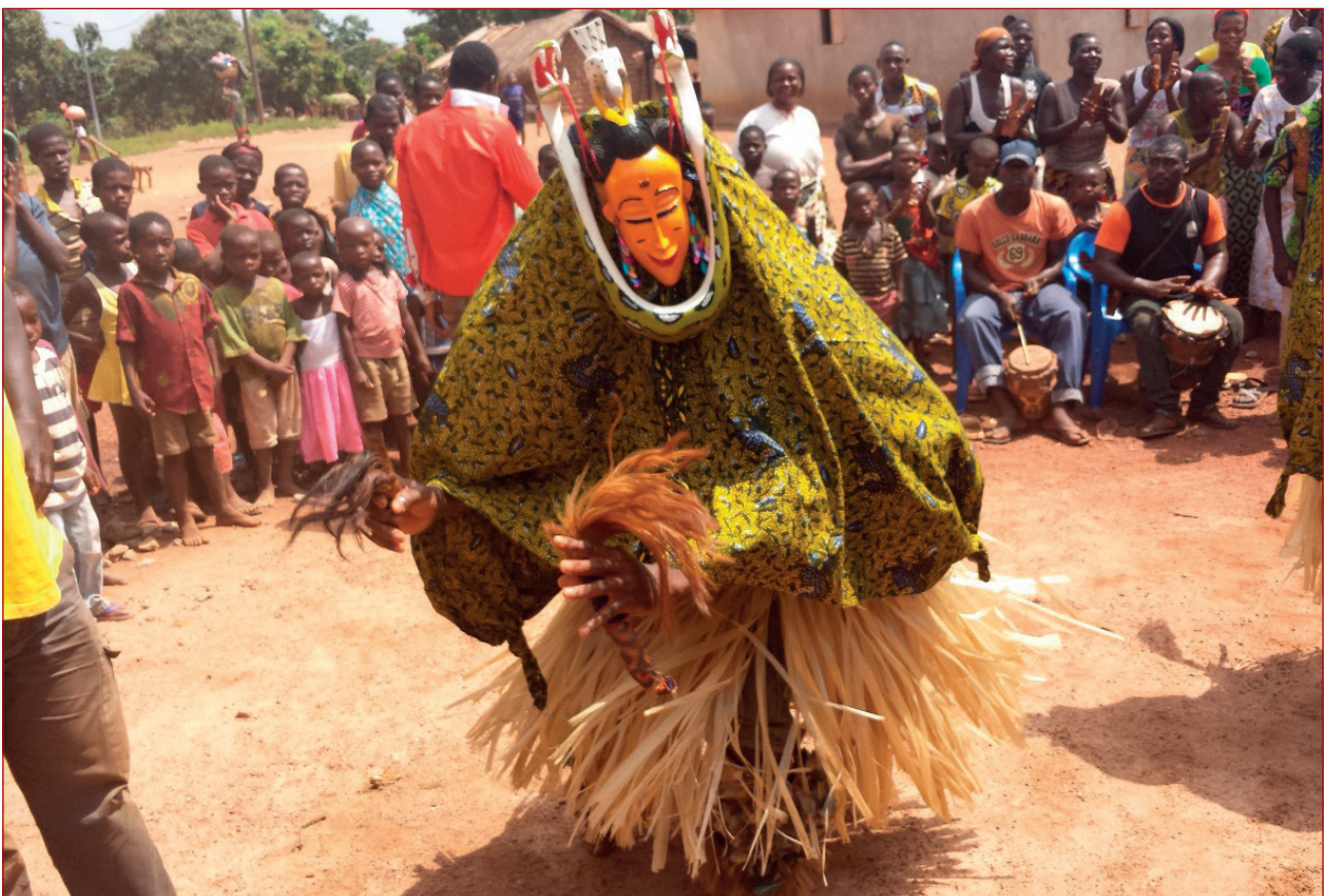
Imagen 10: Danza de máscaras en Toumodi-Sakassou (Costa de Marfil)