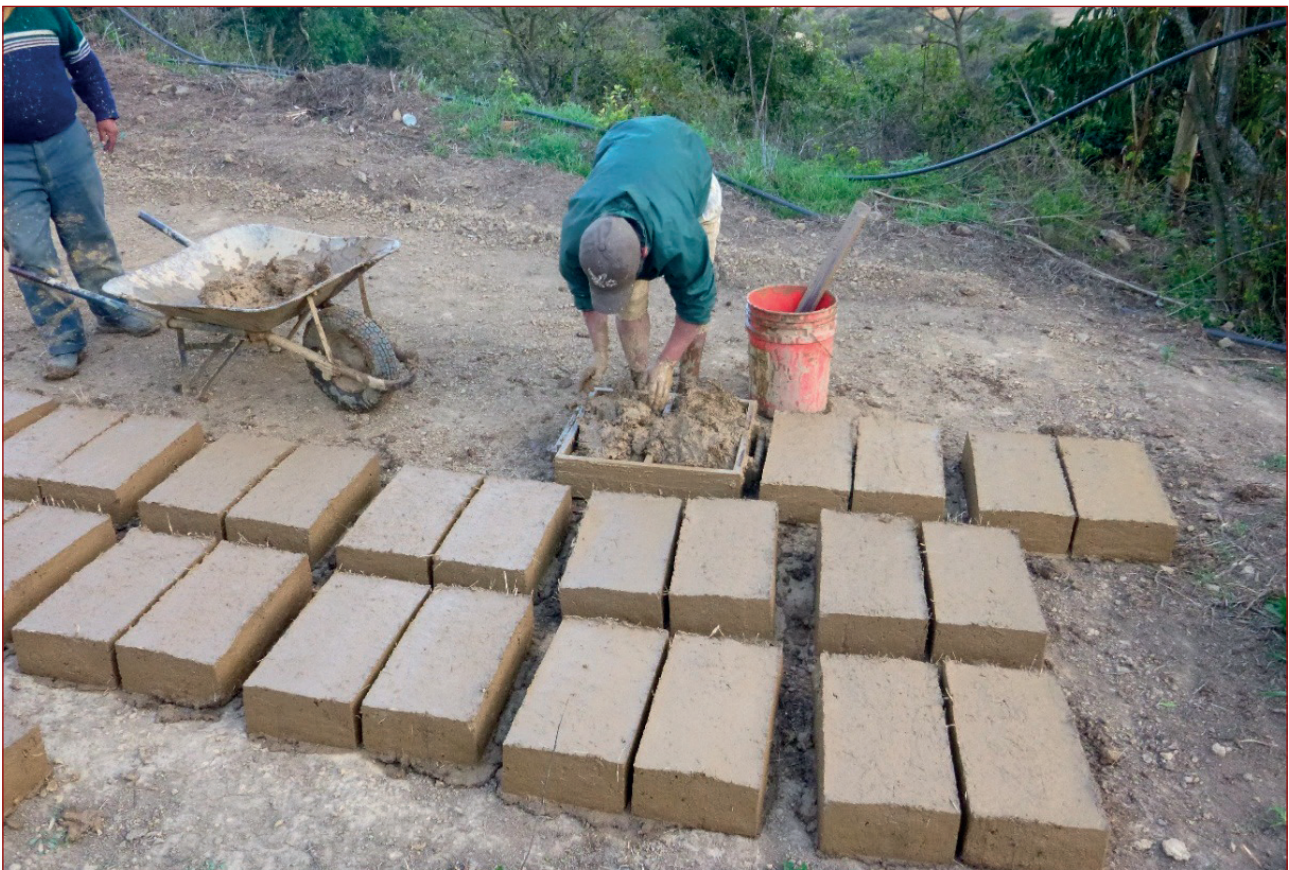
Imagen 4: Fabricando adobes en la comunidad de Huertas (Bolivia)