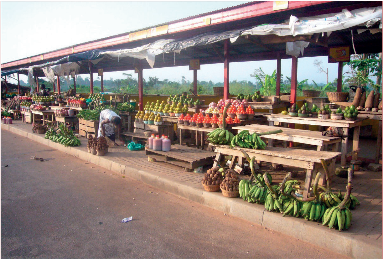
Imagen 9: Mercado ambulante camino de Kumasi (Ghana)