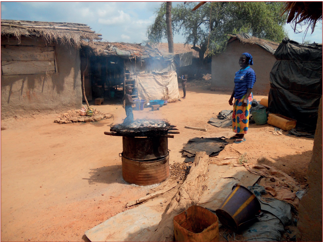
Ahumando pescado junto al Lago Kossou (Costa de Marfil).